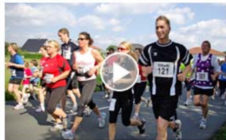
Rund 500 Teilnehmer starten in der Senne 1. Sternchenlauf ein voller Erfolg