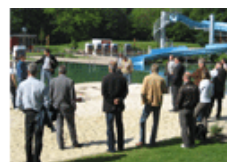
Brackwede Forum Naturbaden